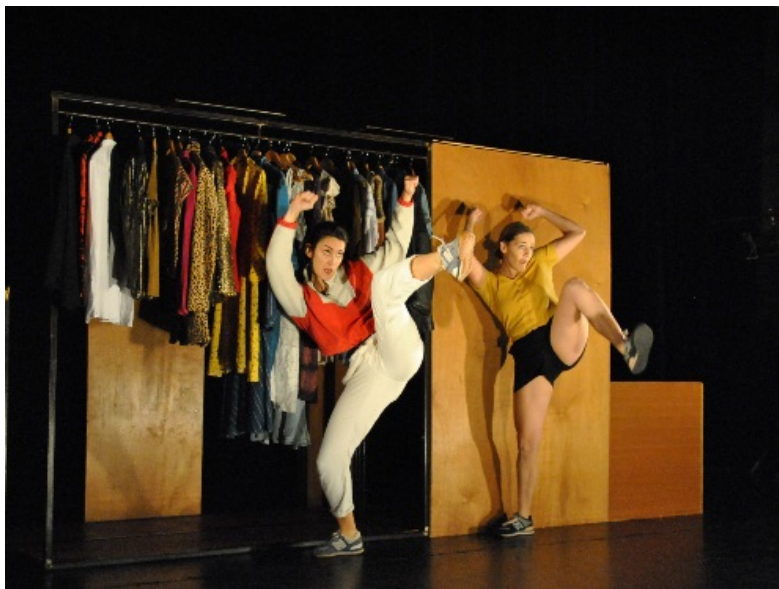
Par instant...Les gens dansent - Version en salle au Carré d'Arts d'Elven, en novembre dernier

>> Voir le teaser de la version en salle