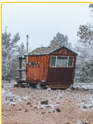
Notre future cabine à confidences est en cours d'élaboration... A ce stade tous les rêves sont permis !

Cette idée bien germée est le nouveau bébé, un dispositif à la croisée des arts et des interactions !