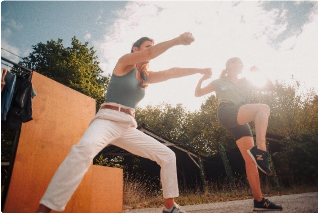
Par instant...Les gens dansent - Version Hors-les-murs

Aller c'est parti les grands, les petits... le mouvement c'est la vie !